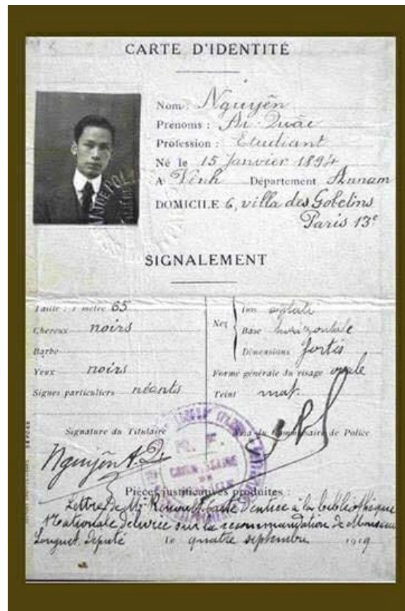
CARTE D'IDENTITÉ (THẺ CĂN CƯỚC)

Đúng 100 năm trước, vào đầu tháng 9/1919 Nguyễn Tất Thành đến sở Cảnh sát Pháp khai tên là Nguyễn Ái Quốc, xuất trình các chứng từ hỗ trợ để xin cấp thẻ căn cước như sau: