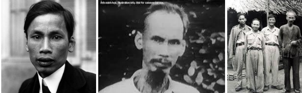
1) Nguyễn Ái Quốc, trán gọn. 2) Hồ Chí Minh vàng trán cao. 3) HCM và thuộc hạ.

Các hình của HCM cho thấy trán cao (cao hơn 1/3 khuôn mặt, đo từ cằm đến chân tóc) trong lúc Nguyễn Ái Quốc trán vừa phải, khác hẳn. HCM không hói, chỉ về già tóc bạc. Giống nhau mười điều, chỉ 1 điều khác thì đã là người khác. Đã có nhiều nguồn tin đáng tin cậy đăng tin Nguyễn Ái Quốc chết do lao phổi trong nhà tù ở Hong Kong năm 1932.