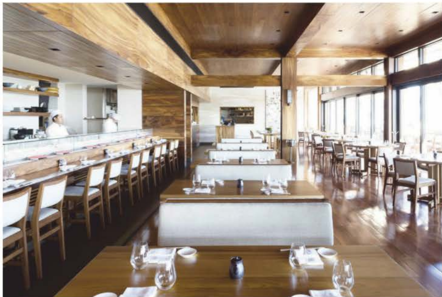
En sentido horario La arquitectura del Nobu Restaurant estuvo a cargo de Severino Tatangelo de Studio PCH, quien ha creado otros espacios gastronómicos para la marca. El jardín culinario ofrece un espacio para la relajación. En las habitaciones se combina el minimalismo japonés con materiales y acabados mexicanos.