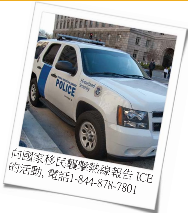
向國家移民襲擊熱線報告 ICE 的活動，電話1-844-878-7801