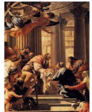
Presentación del Niño Jesús en el Templo

"Su padre y su madre estaban admirados de lo que se decía de Él" (Lc.2, 33). El Buen José y la Bella María comprenden con claridad lo importante de su ofrecimiento, en el Templo de Jerusalén presentan a Aquel que siendo la Gloria de Israel, también es la Salvación de la humanidad.