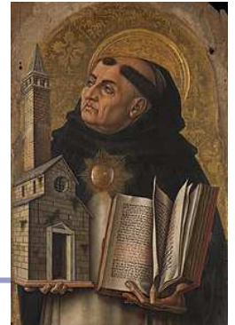
St Tomas de Aquino "El Doctor Angelico"