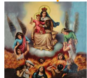
Virgen del Carmen y las almas del purgatorio

“Pregunté a las almas ¿cuál era su mayor tormento? Y me contestaron unánimemente que su mayor tormento era la añoranza de Dios”.