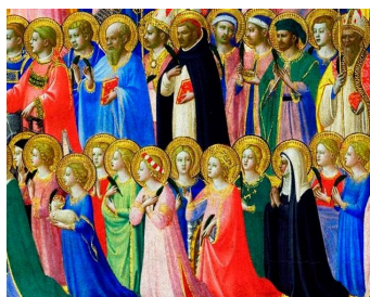
“Los precursores de Cristo con los Santos y los Mártires”. Pintura de Fra Angélico .Galería Nacional, Londres , Inglaterra.

en este mes leamos y estudiemos los escritos y la vida de un santo de su preferencia, aprender de el o ella y de esa manera encontrar ejemplos, luces, inspiraciones para vivir una vida cristiana mejor y mas intensa. El día 2 de Noviembre la Iglesia conmemora a todos los fieles difuntos. Y este