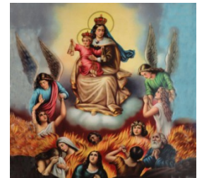
Virgen del Carmen y las almas del purgatorio

“Pregunté a las almas ¿cuál era su mayor tormento? Y me contestaron unánimemente que su mayor tormento era la añoranza de Dios”.