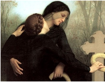
“El día de los Muertos”. Wilhelm Adolphe Bouguereau .1859)

pero hay aun imperfecciones en su alma debido a las consecuencias temporales de esos pecados estas deben ser purificadas en el purgatorio. Esa es la llamada Iglesia purgan-