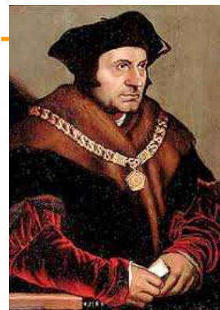
SANTO TOMAS MORO

del rey Enrique VIII se convierte en vinculo de gran amistad entre ambos.. El rey Enrique VIII se hace llamar "Rey de Inglaterra y Señor de Irlanda", no se interesa precisamente en el bienestar del pueblo y leyes justas o seguir los mandatos de la Iglesia Católica. El rey se enemista con Tomas Moro debido a las desavenencias surgidas en torno a la validez de su matrimonio con su esposa, la reina Catalina de Aragón, quien sin haber dado motivo era repudiada por el rey, quien buscaba la aprobación del Papa para anular su matrimonio y contraer nupcias con Ana Bolena. El monarca insistió en obtener la nulidad de su matrimonio, así se habría borrado su infidelidad, sin embargo ante las sucesivas negativas de Tomas Moro, que consideraba el hecho como una injusticia provocaron el rencor de Enrique VIII y se dio la ruptura con la Iglesia Católica. Tomas Moro es enjuiciado y declarado culpable de alta traición lo que lo lleva al encarcelamiento y posteriormente el 6 de Julio del año 1535 es