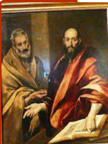
Apóstoles San Pedro y San Pablo

5 cosas que hace se celebran el mismo día: