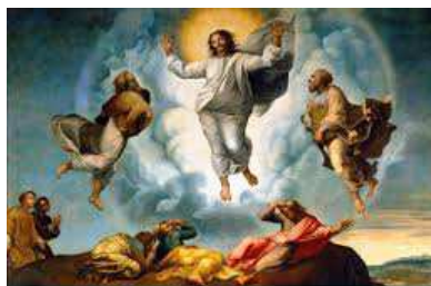
La Transfiguración del Señor

Moisés y Elías quien se aparecieron junto a NSJ en el monte Tabor. Ellos representan la antigua Ley, pero en Jesucristo se revela la Nueva y Eterna Ley. La luz de Dios se revela plenamente en Jesucristo. San Pablo nos sigue diciendo: "cuando se vuelvan al Señor, será descorrido el velo. El Señor es espíritu, y donde está el Espíritu del Señor, ahí está la libertad. Y todos nosotros, reflejando como en un espejo en nuestro rostro descubierto la