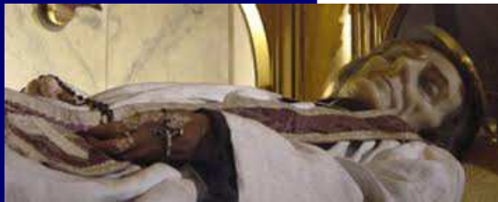
Cuerpo incorrupto del Santo Cura de Ars

“Te amo, oh mi Dios, y mi único temor es ir al infierno Porque ahí nunca tendría la dulce consolación de tu amor...”