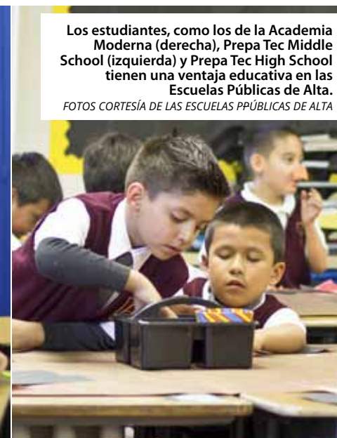
Los estudiantes, como los de la Academia Moderna (derecha), Prepa Tec Middle School (izquierda) y Prepa Tec High School tienen una ventaja educativa en las Escuelas Públicas de Alta.

nuestros estudiantes vivirán en una época muy progresiva y orientada a nivel global. Deseamos conectar a nuestros estudiantes con el mundo”.