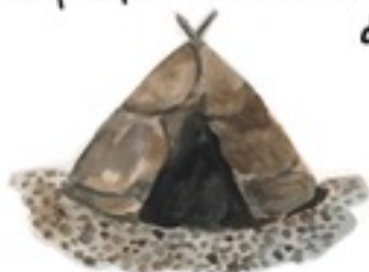
Tente d'été faite de peaux