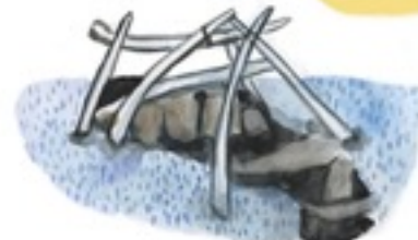
Quarmag fait en os de baleine couverts de peaux

Les contacts avec les Canadiens Blancs se sont intensifiés autour des années 1950-60 alors que le gouvernement Canadien décida d'établir des communautés "fixes" et d'y DÉPLACER LES INUIT , pour FACILITER :