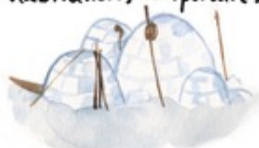
Igloo fait en neige