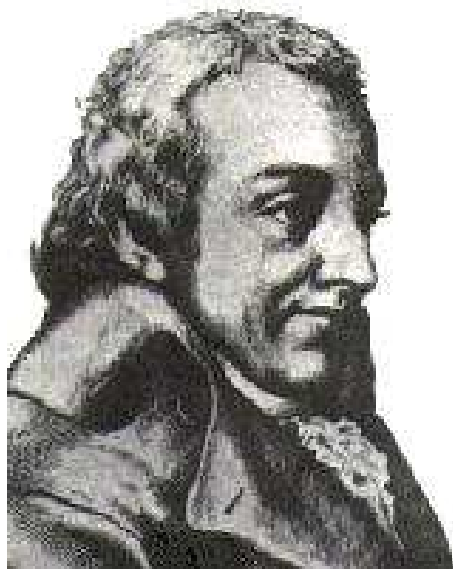
Johann Gottlieb Fichte

"Fast durch alle Länder von Europa verbreitet sich ein mächtiger feindselig gesinnter Staat, der mit allen übrigen im beständigen Krieg steht, und der in manchem fürchterlich schwer die Bürger drückt: es ist das Judentum. - - - Menschenrechte müssen sie haben, ob sie gleich dieselben uns nicht zugestehen; denn sie sind Menschen und ihre Ungerechtigkeit berechtigt uns nicht, ihnen gleich zu werden. -