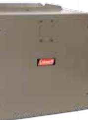
Souffleur modulaire (MX-MV)