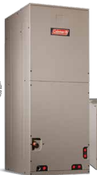
Souffleur une pièce (AHE-AHV) avec évaporateur