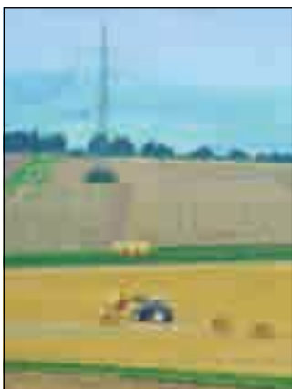
FÅ: 26 gårder gikk konkurs i fjor.