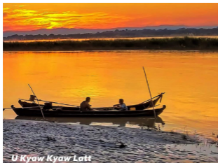
U Kyaw Kyaw Latt Samsung Galaxy A 70