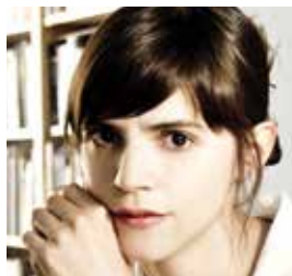
Valeria Luiselli Lauréate du Prix Metropolis Azul 2016