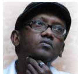
Abdourahman Waberi Lauréat du Prix Des mots pour changer