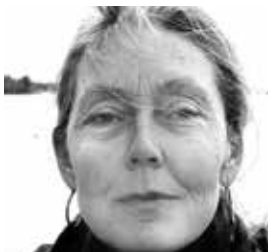
Anne Carson Lauréate du Grand Prix littéraire international Metropolis bleu 2016