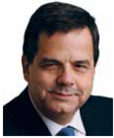
Mot du président du conseil d'administration