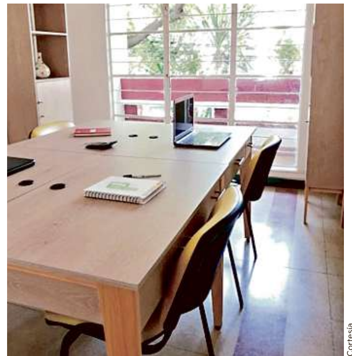
■ Crearán dentro de las oficinas lugares para que los hijos de las inquilinas puedan tomar clases.

Además, se buscará adaptar en sus actuales 240 metros cuadrados de espacio cabinas especiales en las que los usuarios podrán hacer de manera privada videoconferencias, con mayor privacidad y sin distracciones, así como infraestructura necesaria, además de oficinas privadas y áreas comunes.