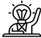
Liderazgo Adaptativo para la Transformación Social