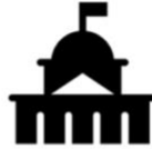
Fundamentos de Política Pública