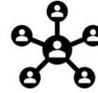
Lineamientos de colectivos y redes alrededor de propósitos para la incidencia pública

En segundo lugar, te formarás en habilidades para la vida, las cuales hoy en día son necesarias y cruciales para desempeñarte como ciudadano y actor de transformación y desarrollo en tu territorio. Para lo siguiente, se desarrollarán las siguientes habilidades para la vida: