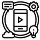
Digitales y Tecnológicas

LISA tiene dos grandes objetivos. El primero es formarte con habilidades técnicas y vocacionales para fortalecer tu empoderamiento económico. Para lo siguiente, se desarrollarán las siguientes competencias técnicas: