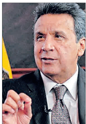
Lenín Moreno. Una de las opciones para suceder a Correa.

Moreno, quien fue vicepresidente del país entre 2007 y 2013, sostuvo que “preferiría no hacerlo porque después de esta actividad, tenía la intención de regresar a mi casa y vivir con tranquilidad; pero si el movimiento político del señor