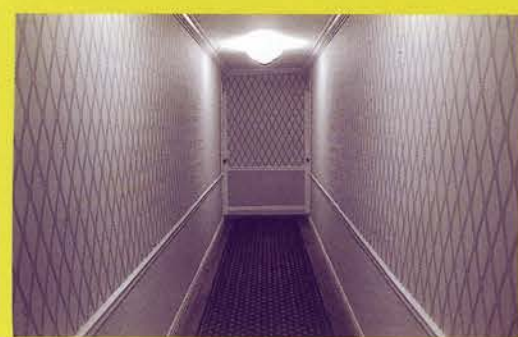
J. GRIMBLATT, PASILLOS

relacionadas por la idea central que las agrupa: articulan las particularidades, conexiones, complejidades y fragmentaciones del arte latinoamericano, desde el origen mismo de su proceso de formación hasta sus más recientes creaciones artísticas. ♦ ♦ En su conjunto, el proyecto no pretende historiar el arte latinoamericano, sino que busca en las particularidades de movimientos, etapas y actitudes referencias para organizar, desde una mirada múltiple y plural, los conceptos de mestizaje y apropiación propios del proceso postcolonial, de los diferentes modos en que este continente asume la modernidad y de las alternativas críticas que ofrece al occidente. ♦ ♦ La estructura de Versión del sur... se divide en cinco ejes expositivos que se inauguran simultáneamente en todas las salas de exposiciones temporales del Museo Nacional Centro de Arte Reina Sofía* y constituyen el proyecto más ambicioso que este centro ha organizado en relación con el arte latinoamericano.