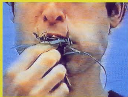
L.F. HERRAÁN, SIN TÍTULO

*La exposición Eztetyka del sueño se inaugurará el día 23 de enero de 2001 en los palacios de Velázquez y de Cristal del Retiro