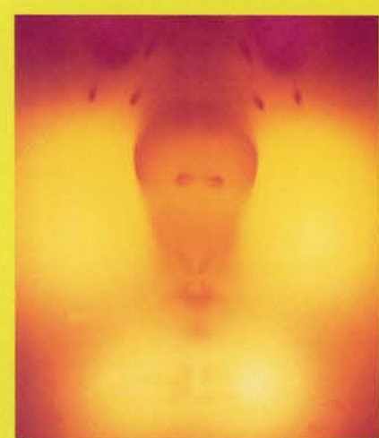
A. PALATNIK, OBJETO CINÉTICO

artística en el ámbito geográfico del continente americano. Las exposiciones que conforman este proyecto, comisariadas individualmente, son, en su concepto, únicas, pero a la vez también están