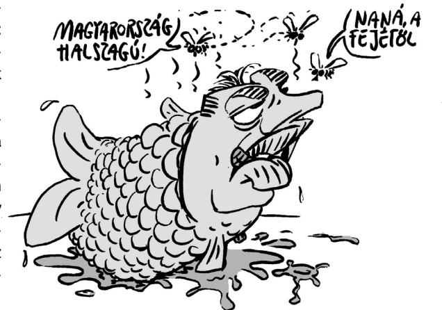
Nem a vejétől, a fejétől büszkik a hal | Illusztráció: Pápai Gábor

Ellenzéki politikusok és újságírók szerették volna megismerni a Brüsszelben készített anyagot, de azt a kormány nem akarta nyilvánosságra hozni. A 24.hu online hírportál azonban valakitől megkapta, és részletekben leközölte. Az anyagból kiderül, hogy Orbán