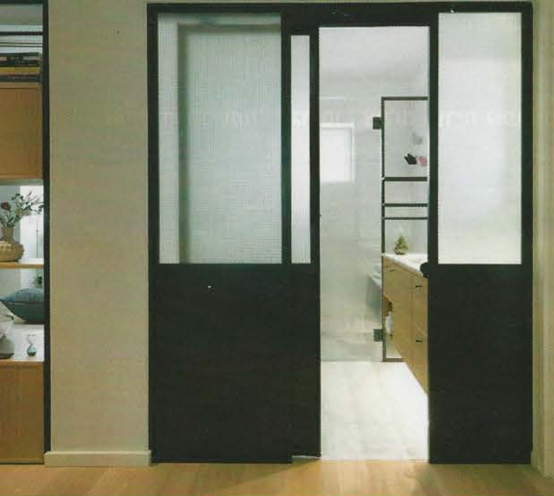
מימין: הקיר המרכזי בסלון מצופה בדוגמת פרקט בטון חשוף. האלון הבהיר מרכז אותן; משמאל: בחדר הרחצה הוחלף הקיר בזכוכית ממוסגרת בברזל, ודלתות אור ומרחב