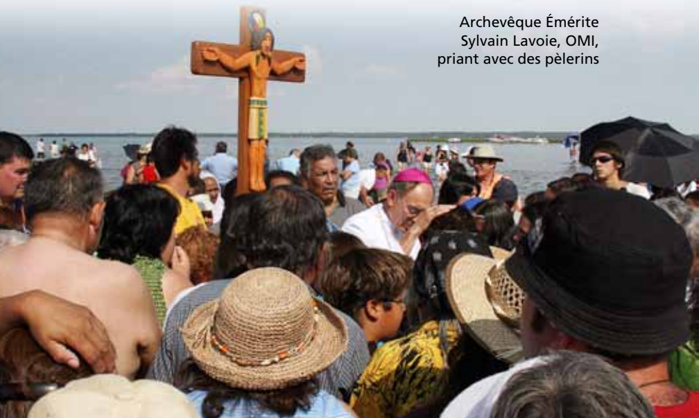
Archevêque Émérite Sylvain Lavoie, OMI, prie avec des pèlerins

Au cours des années, plusieurs changements se sont effectués. Présentement, un comité sans but lucratif dirige les activités reliées au pèlerinage annuel qui accueille jusqu'à 30,000 pèlerins. C'est le seul conseil administratif au Canada où plusieurs représentants de