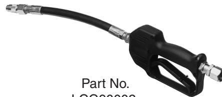
Part No. LCG90002