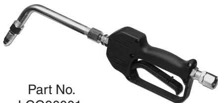
Part No. LCG90001

Poignée de distribution d'huile avec buse anti-goutte manuelle et rallonge rigide en ligne.