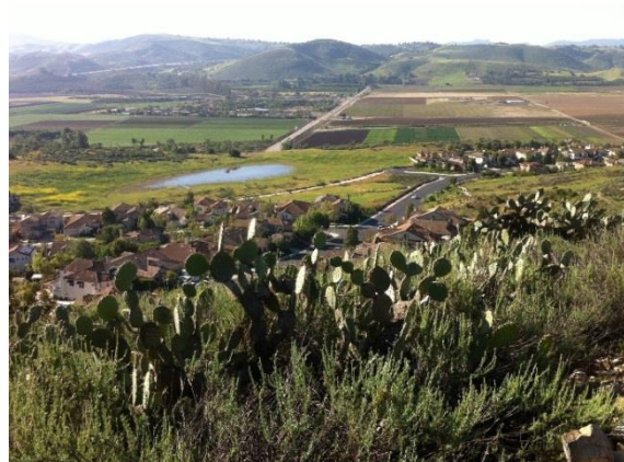
Figuras 3 y 4. Fotos de los senderos y recursos naturales de Moorpark enviadas por los participantes de la encuesta.